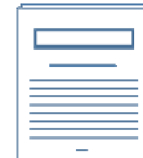
Herbst 2002 Download (pdf)