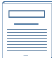
Herbst 2003 Download (pdf)