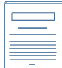
Sommer 2005 Download (pdf)